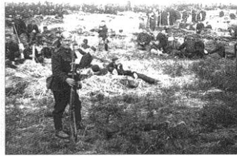
September 1914 De eerste gevangenen en onze burgers moesten onder de bladen hermet slagen zoals hazen!