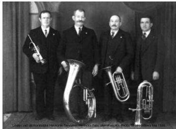
Leden van de Koninklijke Harmonie, mei 1938