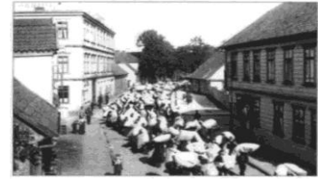
Belgische gevangenen op stap door de stad van de twee steden naar het kamp.